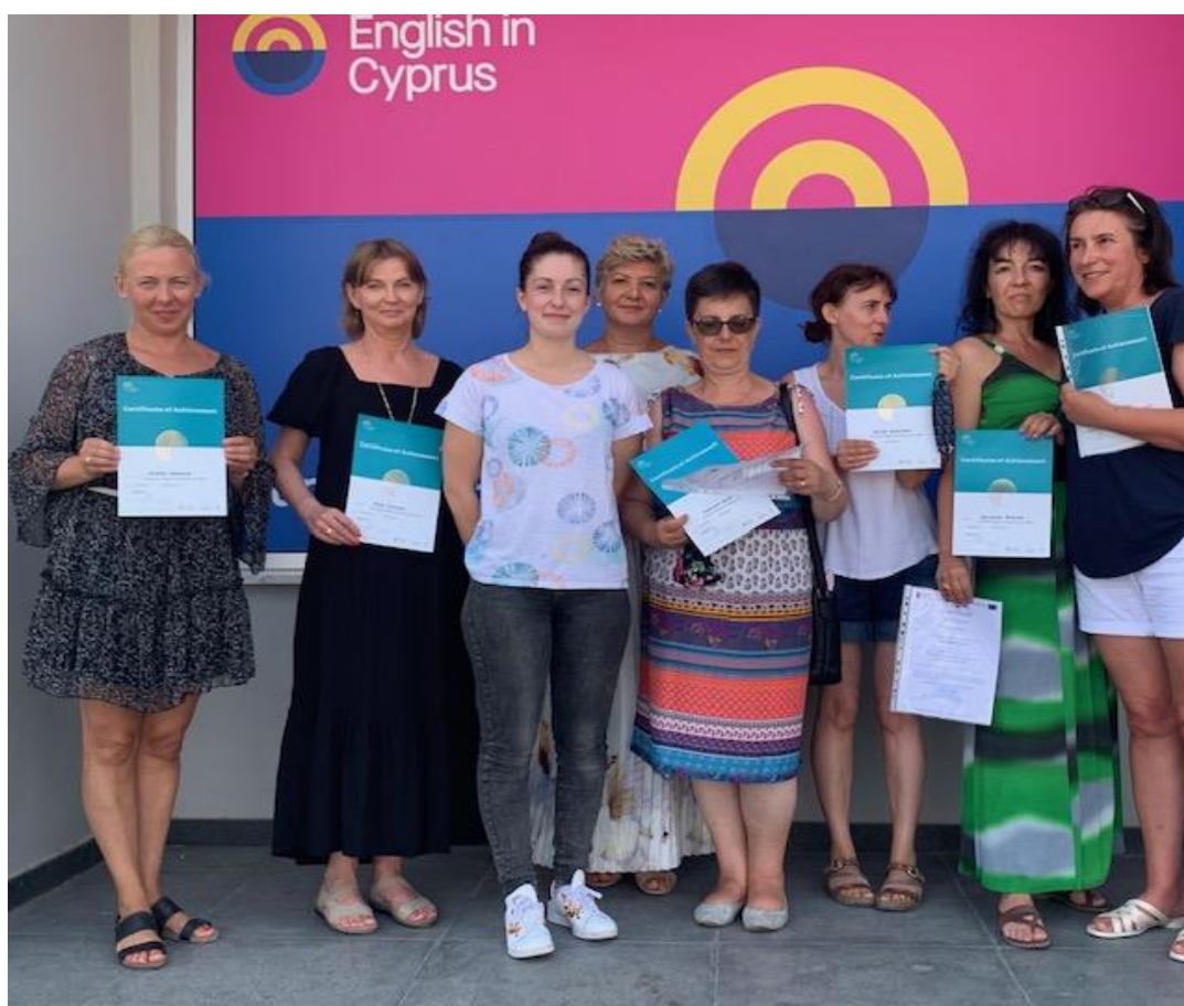
Grupa pedagogów z certyfikatami potwierdzającymi kompetencje językowe, English in Cyprus, Cypr 2021